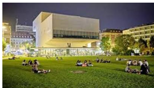
mitfinanziert durch das Casino Freiburg.

Das Casino Freiburg unterstützt jährlich die Stiftung CORIOLIS, die gemeinnützige und kulturelle Projekte in der Agglomeration Freiburg finanziert.